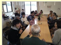
子ども学習支援・防災教育及び 仮設住宅でのコミュニティ支援