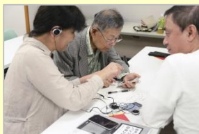
視覚障がい者へのタブレット端末 インストラクター養成事業