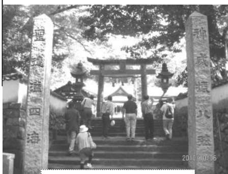
↑八所宮にて現地調査

むなかた協働大学観光アドバイザーコースの21年度卒業生で立ち上げた「観光むなかた」では、「観光客や市民に宗像の情報を知ってもらおう」をコンセプトに、実用ガイドマップの作成に取り組んでいます。