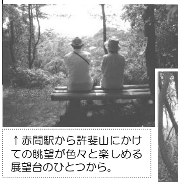
↑赤間駅から許斐山にかけての眺望が色々楽しめる展望台のひとつから。

この遊歩道はコミュニティを中心に、地権者の了解のもとに、市の支援を受け、NPO法人宗像里山の会、ボランティア(47人)の協力をいただき、自由ヶ丘地区コミュニティ10周年の記念事業として整備されました。